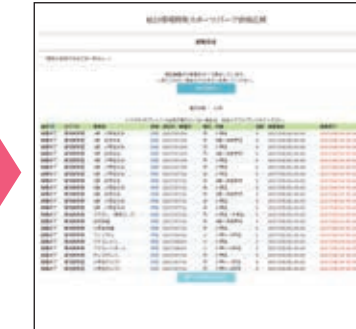
登録メールアドレスに応募完了メールが届きます。