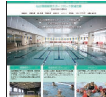
「仙台環境開発スポーツパーク宮城広瀬」で検索!