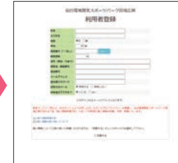
登録メールアドレスに登録完了メールが届きます。