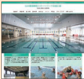
「仙台環境開発スポーツパーク宮城広瀬」で検索!