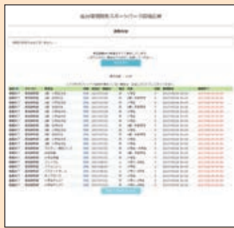
登録メールアドレスに応募完了メールが届きます。