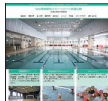
「仙台環境開発スポーツパーク宮城広瀬」で検索!