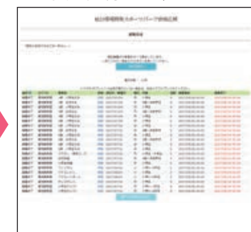
登録メールアドレスに応募したメールが届きます。