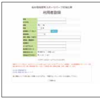
登録メールアドレスに登録完了メールが届きます。 ※設定状況によりメールが届かない場合がございます