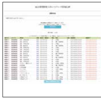
登録メールアドレスに応募完了メールが届きます。 ※設定状況によりメールが届かない場合がございます