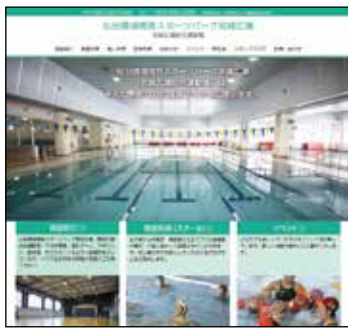
「仙台環境開発スポーツパーク宮城広瀬」で検索!