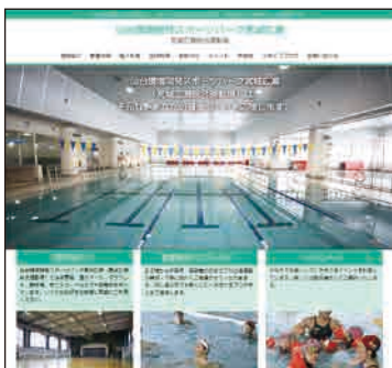
「仙台環境開発スポーツパーク宮城広瀬」で検索!