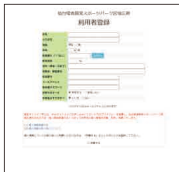
登録メールアドレスに登録完了メールが届きます。