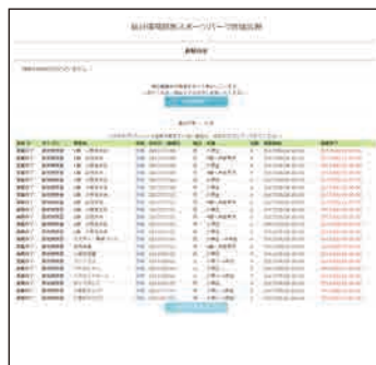
登録メールアドレスに応募完了メールが届きます。