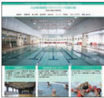
「仙台環境開発スポーツパーク宮城広瀬」で検索!