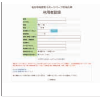
登録メールアドレスに登録完了メールが届きます。 ※設定状況によりメールが届かない場合がございます