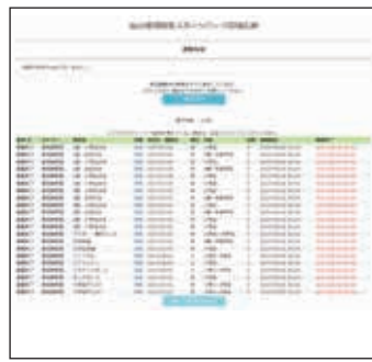
登録メールアドレスに応募完了メールが届きます。 ※設定状況によりメールが届かない場合がございます